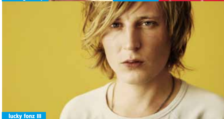
lucky fonz III