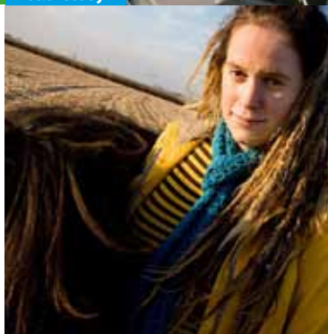
nu nog even niet