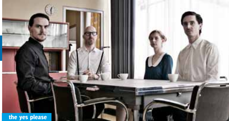
the yes please