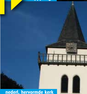
nederl. hervormde kerk