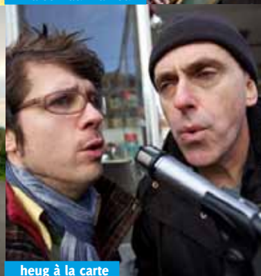
heug à la carte