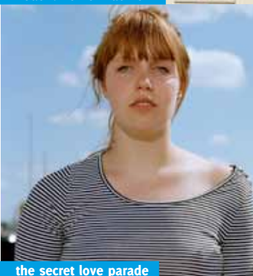
the secret love parade