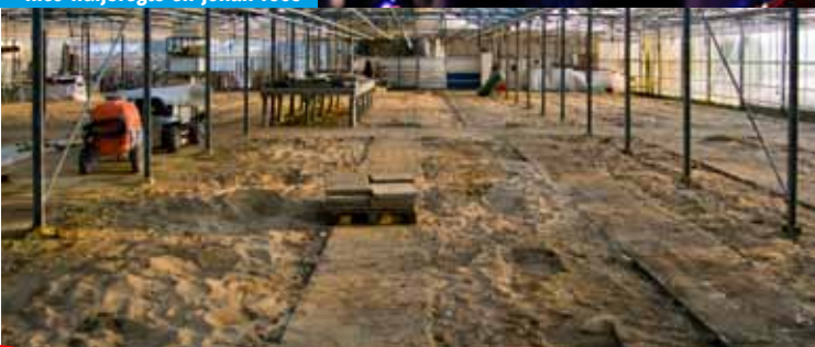
De kassen: Expo Lentse Grond