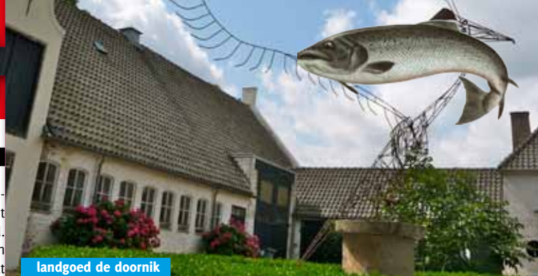
landgoed de doornik

Het roemruchte nummer Fuck you Lucy van de Amerikaanse hiphopband Atmosphere vormt het vertrekpunt voor de Wintertuinproductie Lucy. Het werk van Dennis Gaens, stadsdichter van Nijmegen, en indie-hiphoppers Macronizm is sterk beïnvloed door de muziek van Atmosphere. Nu slaan ze voor het eerst de handen ineen en maken een voorstelling rondom dat ene onbereikbare meisje. Rap en poëzie vloeien moeiteloos in elkaar over en worden ondersteund door de verrassende visuals van Smoove Business.