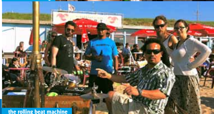
the rolling beat machine