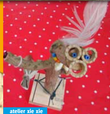
atelier xie xie