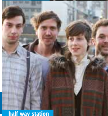
half way station