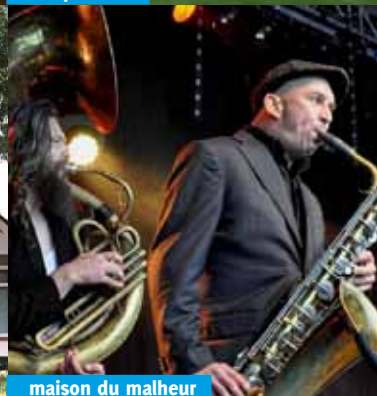
maison du malheur