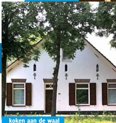
koken aan de waal

Vanaf het moment dat de eerste noten uit de trompet worden geperst en de vooroorlogse drumbeat je hartslag omhoog stuwt word je meegesleurd in een roes van eigenzinnige blues en jazz. De eenvoud en sfeer van klassieke rootsmuziek wordt moeiteloos verbonden met verhalen over nachtelijke omzwervingen, hartstochtelijke liefdes en uitzinnige radeloosheid.