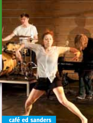
café ed sanders

Een band van muzikanten en dansers, van alleskunnere die spelen, delen, dansen en vechten, op zoek naar echte beleving. Zij zijn Ed Sanders. In Ed Sanders is alles anders. Zij gaan ongebruikelijke, onvoorziene situaties open tegemoet en grijpen de kans aan om een alledaagse omgeving om te toveren tot een eigen theatrale speeltuin. "Café Ed Sanders bruist van de energie. Hier komen jongeren bij elkaar die midden in het leven staan." Eind augustus is de groep in residentie geweest in de Franse heuvels om deze voorstelling te maken.