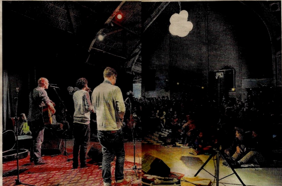
De artiesten die optreden tijdens De Oversteek staan stuk voor stuk voor bijzondere locaties in het groen. Zo stond rapper Typhoon afgelopen jaar op Landgoed Doornik.