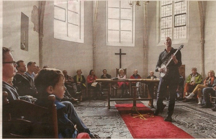
Zondag 13 september doet Festival De Oversteek een zevental locaties aan ten westen van de Waalbrug. Een week later, op 20 september, vindt het festival plaats op acht locaties oostelijk van de Waalbrug.