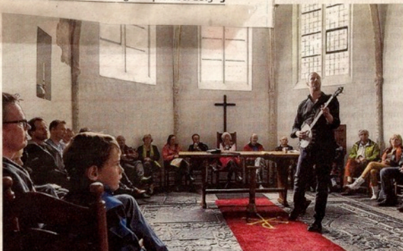
Zondag 13 september doet Festival De Oversteek een zevental locaties aan ten westen van de Waalbrug. Op 20 september ten oosten van de Waalbrug.

De Nijmegenaar · zaterdag 12 september 2015 · 3